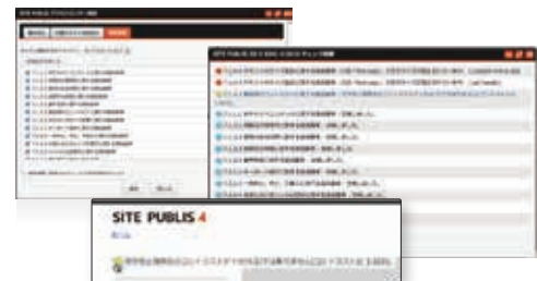
▲アクセシビリティ設定

Webサイトが採用する基準を選択して設定しておくことで、ページ編集時や公開時にアクセシビリティ基準達成要件をクリアするよう検査をし、問題があれば修正を促すなど、簡易的な作業で基準への準拠が図れます。