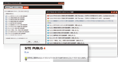
▲アクセシビリティ設定

Webサイトが採用する基準を選択して設定しておくことで、ページ編集時や公開時にアクセシビリティ基準達成要件をクリアするよう検査をし、問題があれば修正を促すなど、簡易的な作業で基準への準拠が図れます。